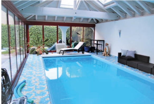
Goldau, SZ (ID 434799) Preis auf Anfrage Einfamilienhaus mit Indor Pool 6.5 Zimmer auf 300m 2 Baujahr: 1998