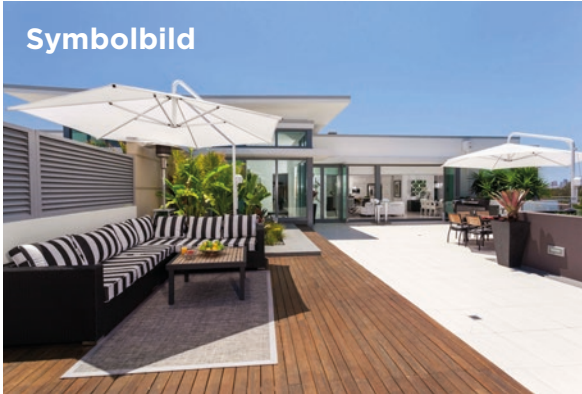
Jetzt bei hoyou.ch anmelden und deine Immobilie hier inserieren!