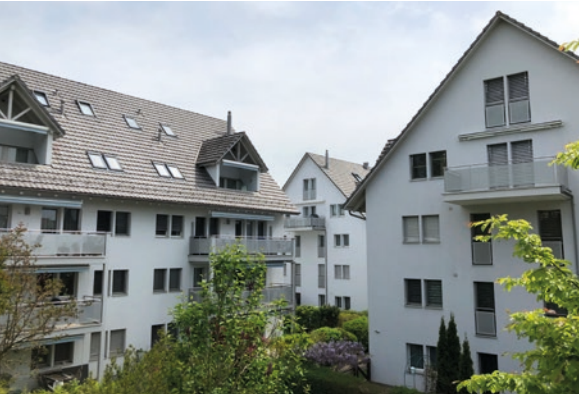
Knonau, ZH (ID 211506) CHF 1'000'000 Etagenwohnung 4.5 Zimmer auf 115m 2 Baujahr: 2004