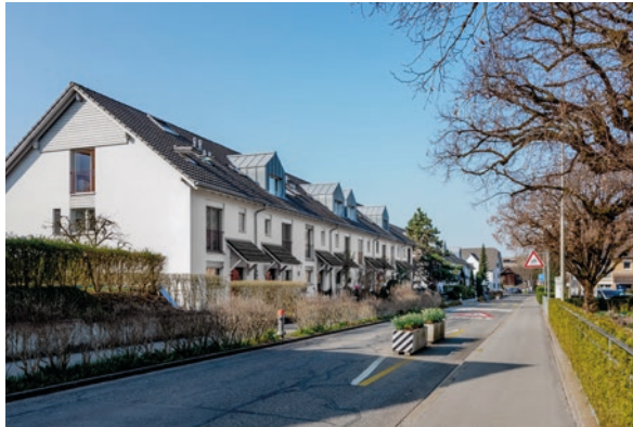
Baar, ZG (ID 212701) CHF 1'990'000 Reihenmittelhaus 5.5 Zimmer auf 150m 2 Baujahr: 1997