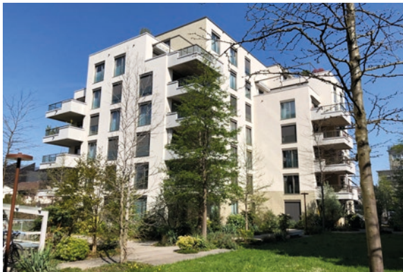
Baar, ZG (ID 407860) CHF 1'750'000 Etagenwohnung 4.5 Zimmer auf 125m 2 Baujahr: 2016