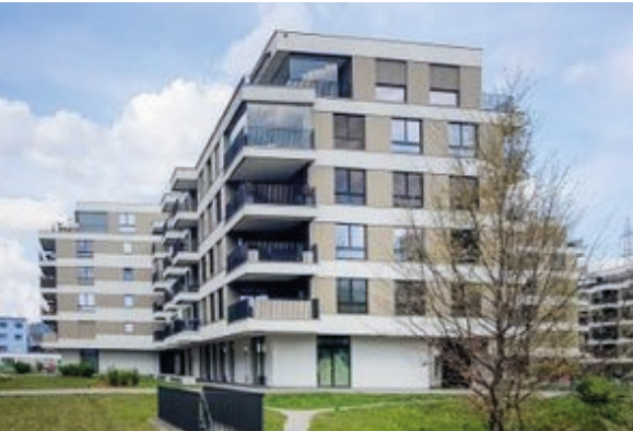
Baar, ZG (ID 231691) CHF 2'000'000 Etagenwohnung 4.5 Zimmer auf 120m 2 Baujahr: 2010