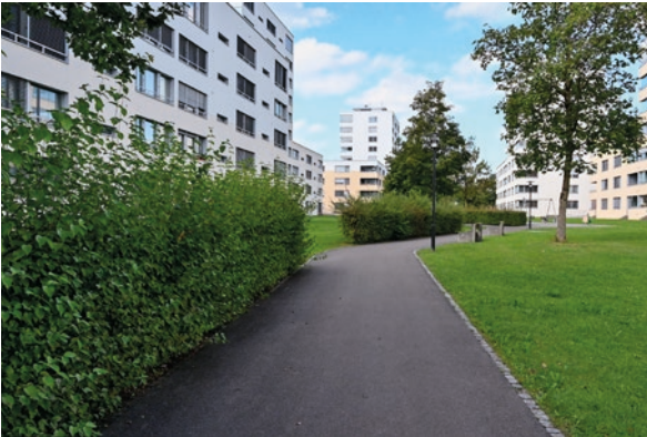
Zug, ZG (ID 254642) CHF 1'860'000 Etagenwohnung 4.5 Zimmer auf 115m 2 Baujahr: 2008