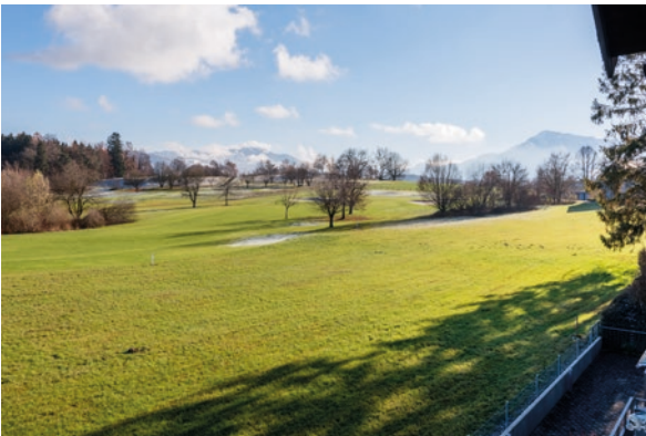
Rotkreuz, ZG (ID 281902) CHF 1'600'000 Reihenhaus 5.5 Zimmer auf 130m 2 Baujahr: 1987