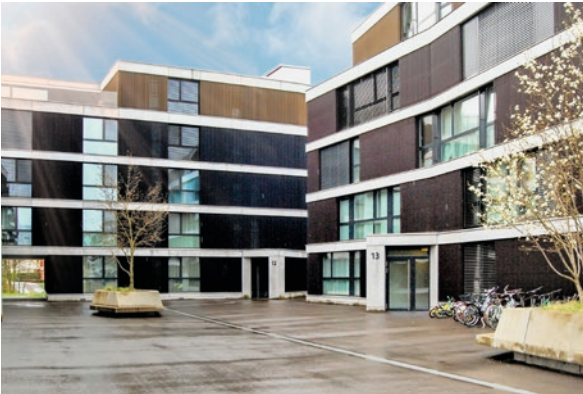
Zug, ZG (ID 488470) CHF 2'500'000 Etagenwohnung 5.5 Zimmer auf 160m 2 Baujahr: 2012