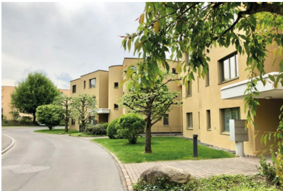
Baar, ZG (ID 408152) Preis auf Anfrage Gartenwohnung 5.5 Zimmer auf 135m 2 Baujahr: 1995