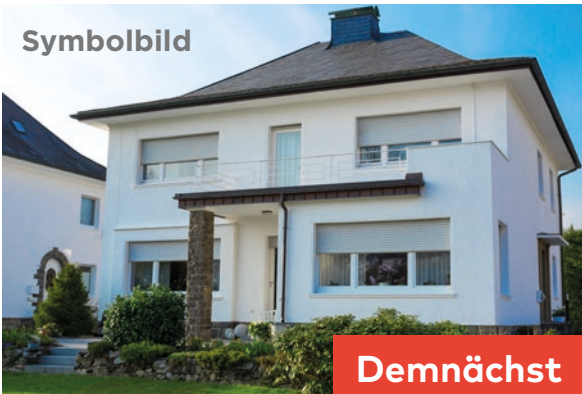
Steinhausen, ZG (ID 493591) Demnächst! Einfamilienhaus 6.5 Zimmer auf 120m 2