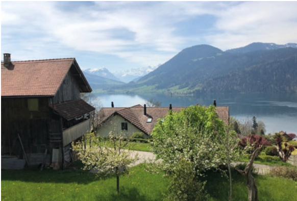
Oberägeri, ZG (ID 492034) CHF 1'400'000 Dachwohnung 3.5 Zimmer auf 110m 2 Baujahr: 1994