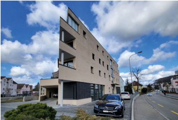
Affoltern am Albis, ZH (ID 499265) CHF 1'150'000 Etagenwohnung 4.5 Zimmer auf 130m 2 Baujahr: 2016