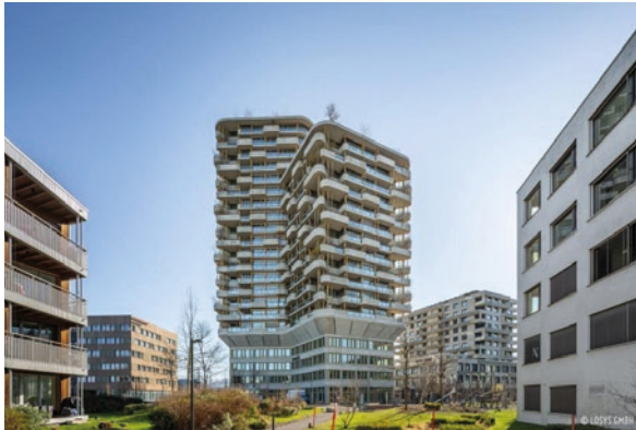
Rotkreuz, ZG (ID 421252) CHF 1'650'000 Etagenwohnung 4.5 Zimmer auf 125m 2 Baujahr: 2019