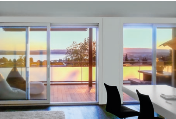
Zug, ZG (ID 358031) Preis auf Anfrage Etagenwohnung 3.5 Zimmer auf 110m 2 Baujahr: 2012