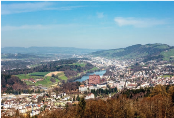
Inwil, LU (ID 318675) CHF 700'000 Maisonettewohnung 3.5 Zimmer auf 110m 2 Baujahr: 1989