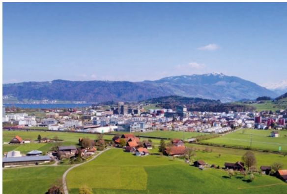
Rotkreuz, ZG (ID 460413) CHF 1'600'000 Etagenwohnung 4.5 Zimmer auf 120m 2 Baujahr: 2016