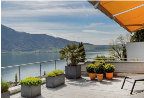
Walchwil, ZG (ID 494556) CHF 2'200'000 Terrassenwohnung 4.5 Zimmer auf 150m 2 Baujahr: 1979